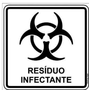
Imagem 1: Símbolo de substância infectante.

Tanto máscaras descartáveis, como as luvas descartáveis são materiais classificados como grupo A, pois tiveram contato direto com a pessoa que os utilizou. Estes resíduos deverão ser acondicionados em sacos plásticos, de cor branco leitoso, com capacidade de 20 a 100L, podendo ser preenchidos até 2/3 do volume e devem ser identificados com a simbologia de resíduo infectante, conforme a imagem abaixo: