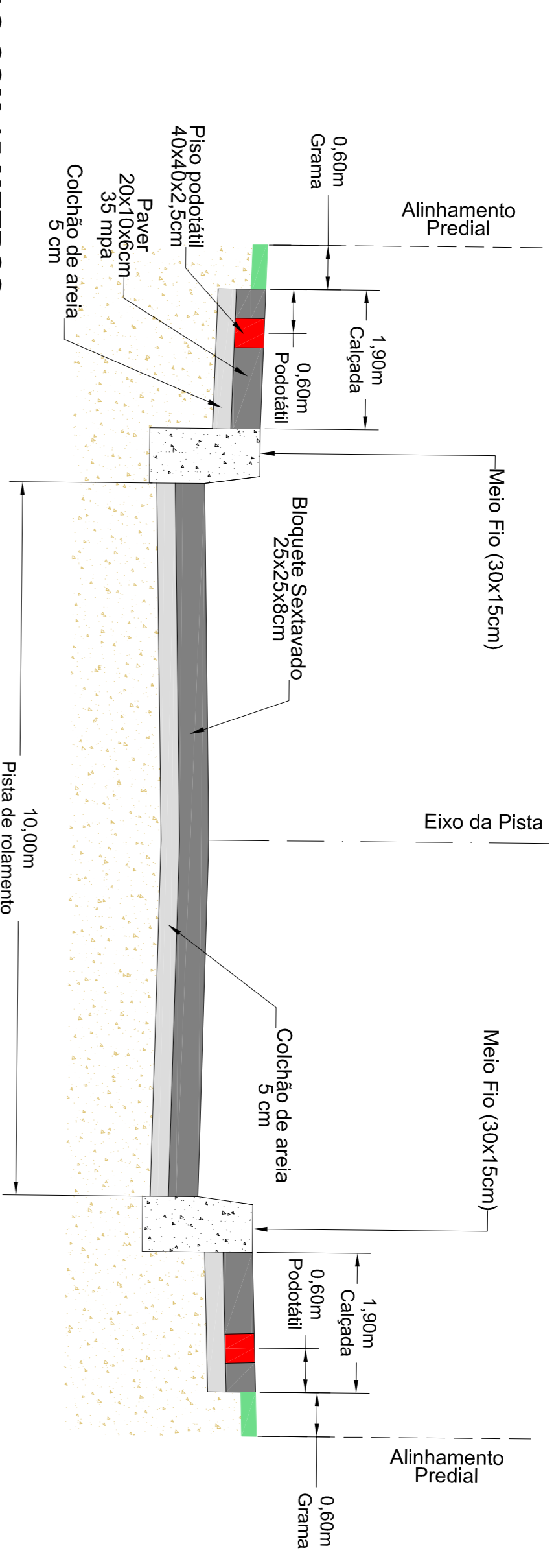
SEÇÃO TIPO PAVIMENTAÇÃO - VIAS COM 15 METROS