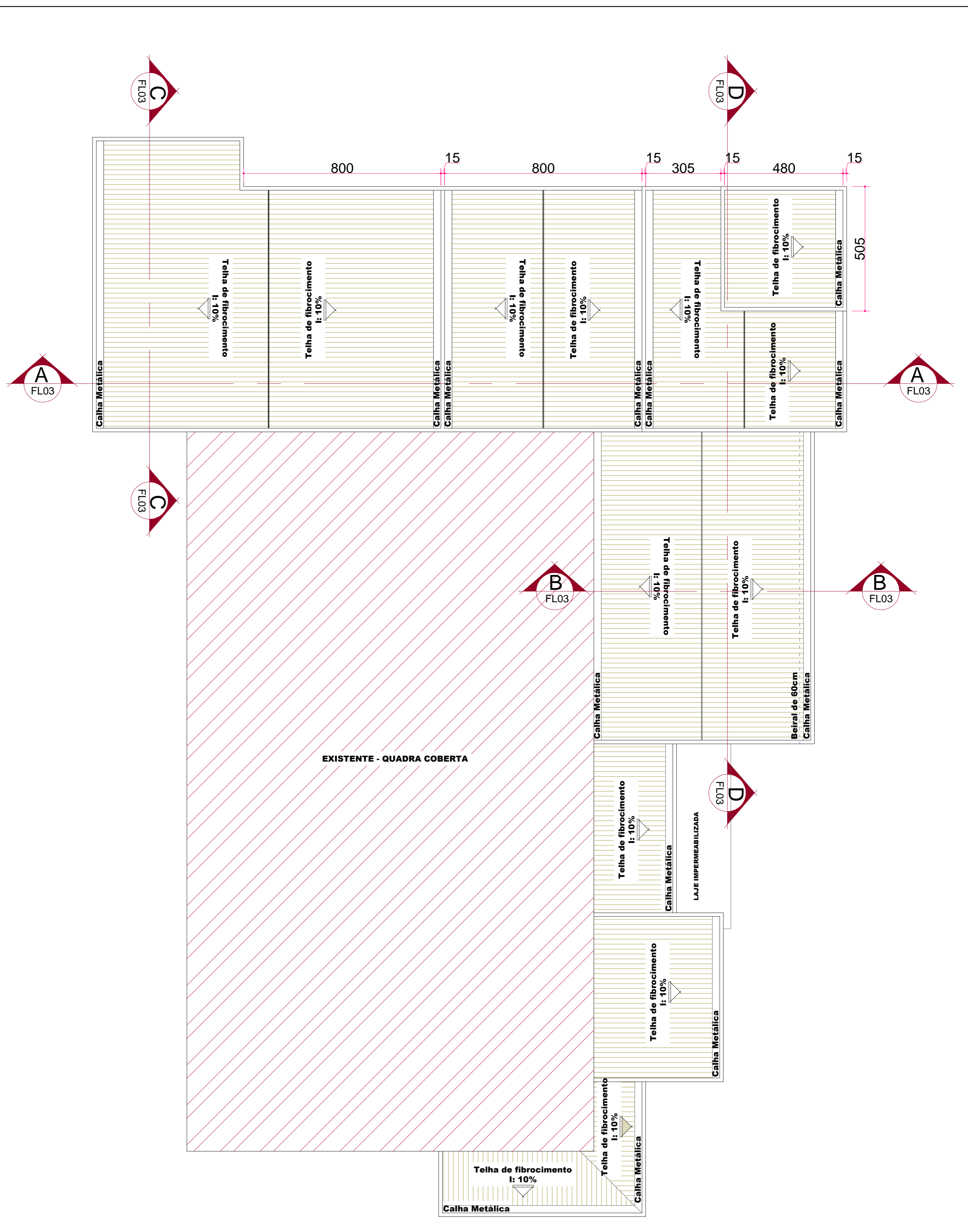
1.4 PLANTA DE COBERTURA ESCALA 1:100