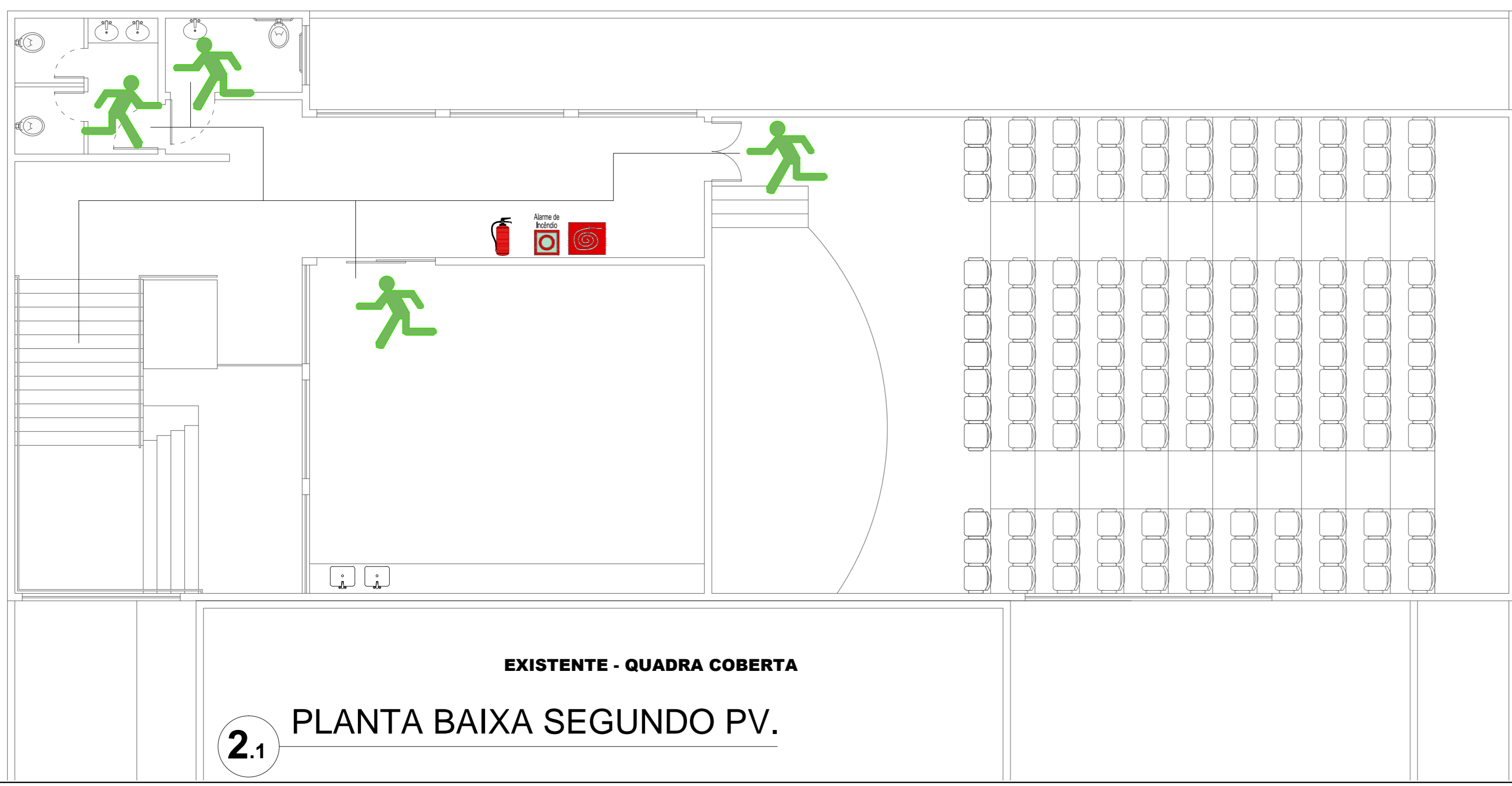
2.1 PLANTA BAIXA SEGUNDO PV.