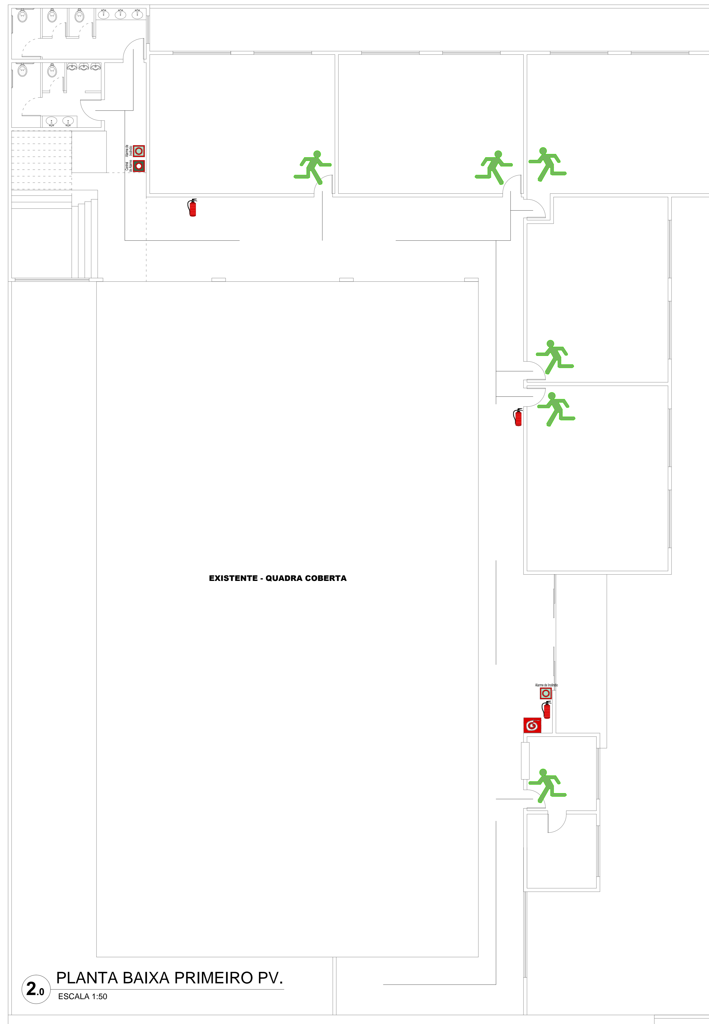
2.0 PLANTA BAIXA PRIMEIRO PV. ESCALA 1:50