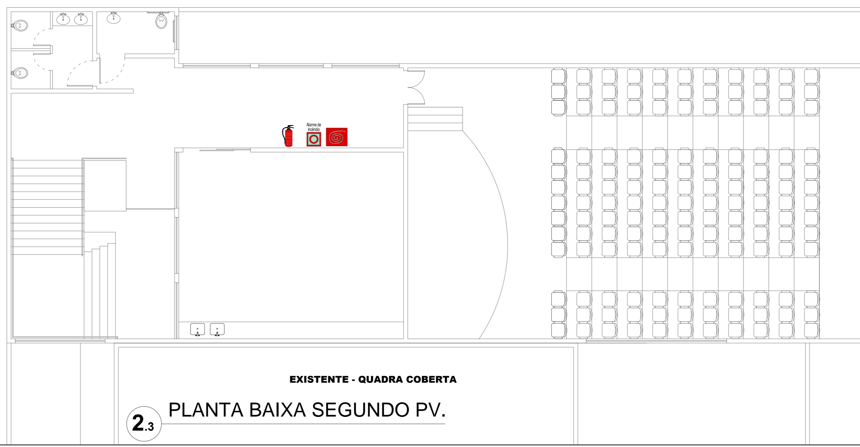
2.3 PLANTA BAIXA SEGUNDO PV.