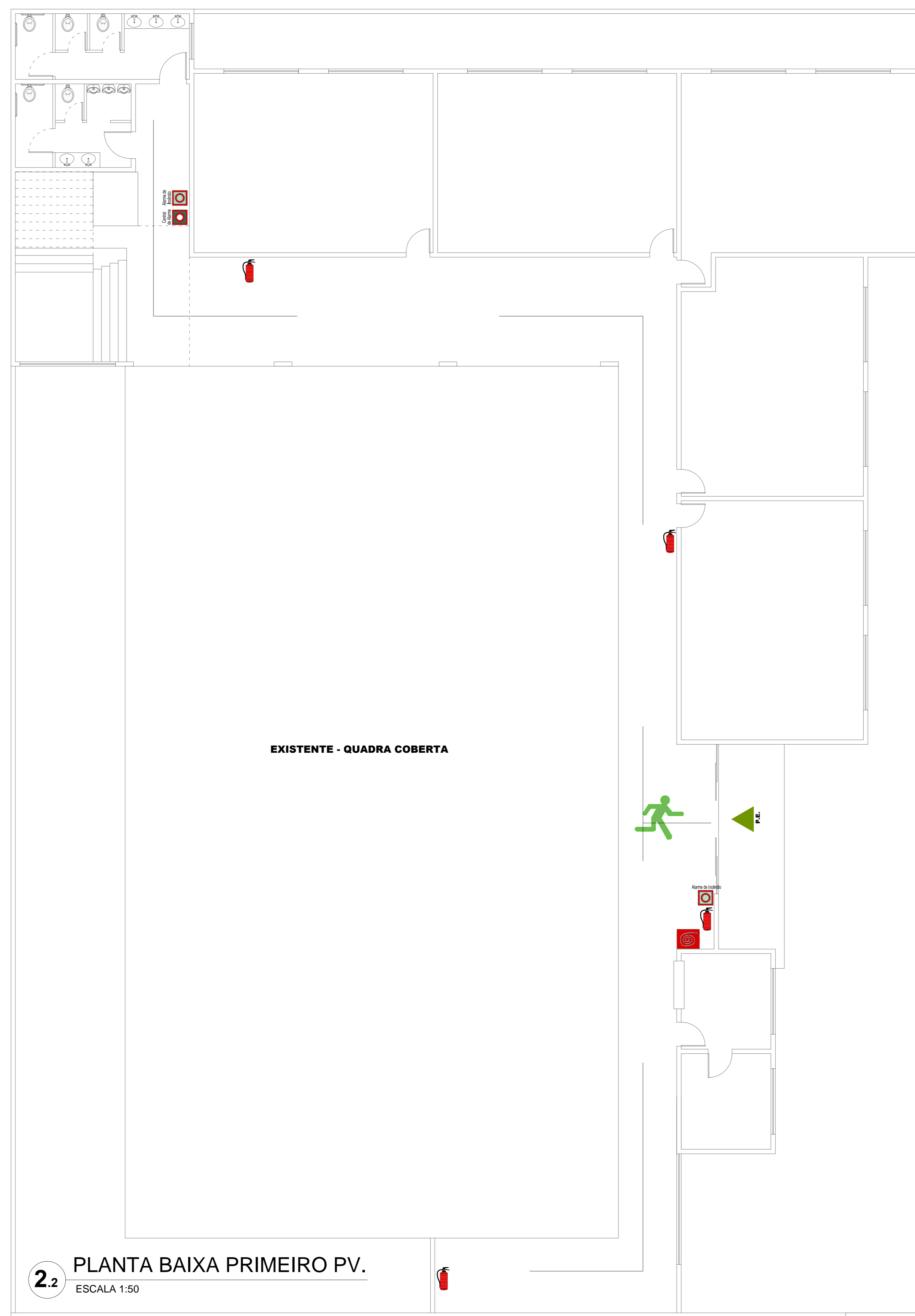
2.2 PLANTA BAIXA PRIMEIRO PV. ESCALA 1:50