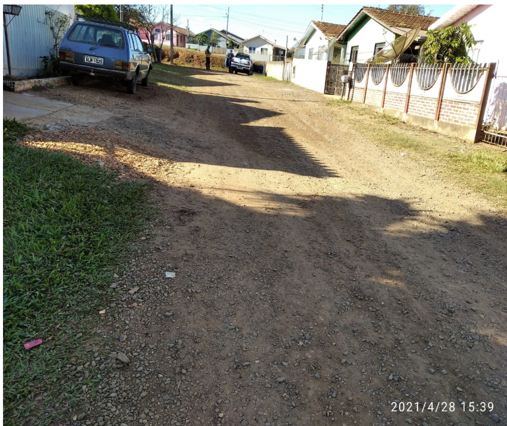
Figura 14 - Rua Exp. Eugênio Alves de Lima