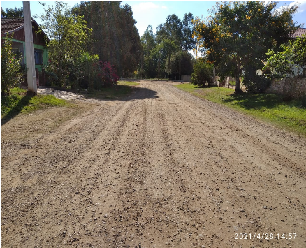
Figura 10 - Rua Alagoas