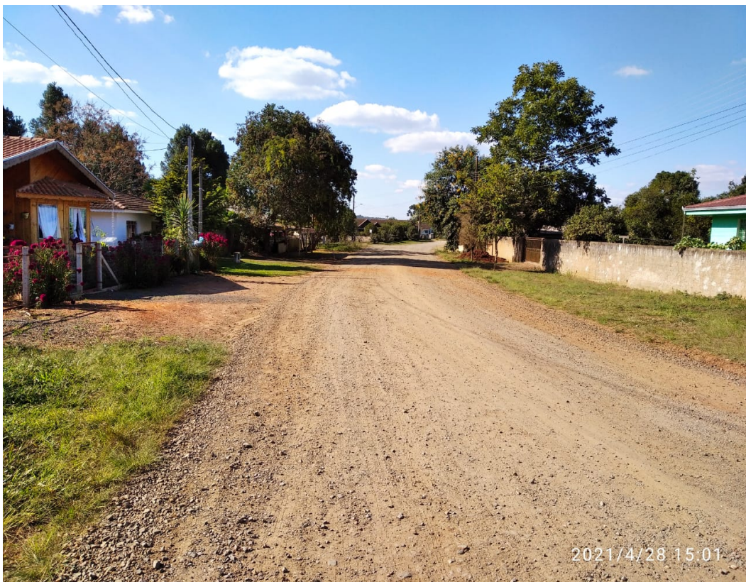
Figura 12- Rua Rio Grande do Su

Majestade Guimarães Ltda. Rua Francisco de Paula Pereira,47 E- mail: glguimaraes47@gmail.com Centro – Canoinhas – SC