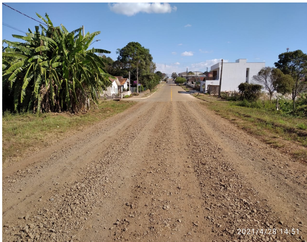
Figura 5 - Rua Mato Grosso