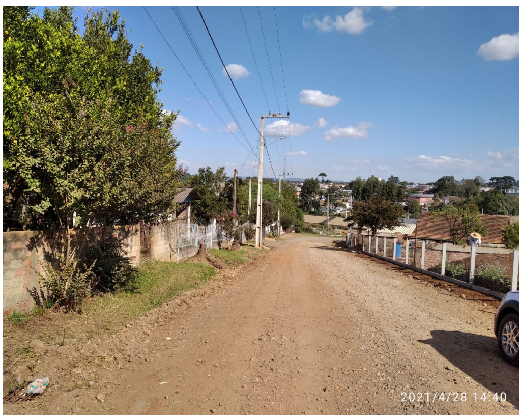
Figura 4 - Rua Mato Grosso

Majestade Guimarães Ltda. Rua Francisco de Paula Pereira,47 E- mail: glguimaraes47@gmail.com Centro – Canoinhas – SC