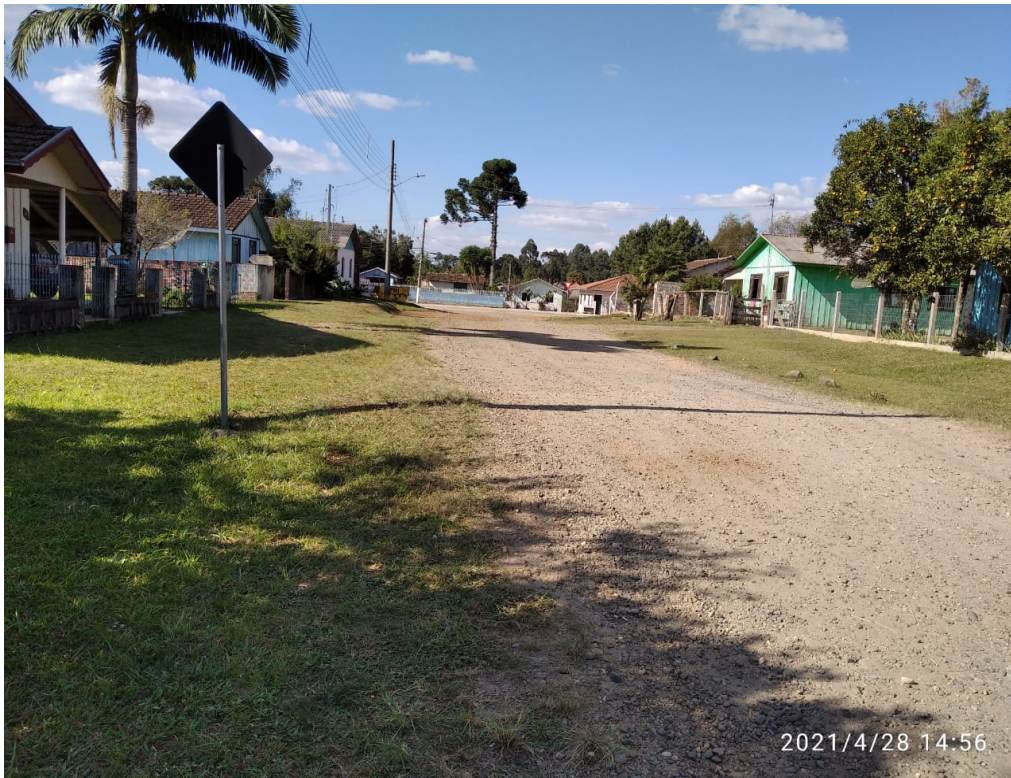
Figura 7 - Rua Piauí