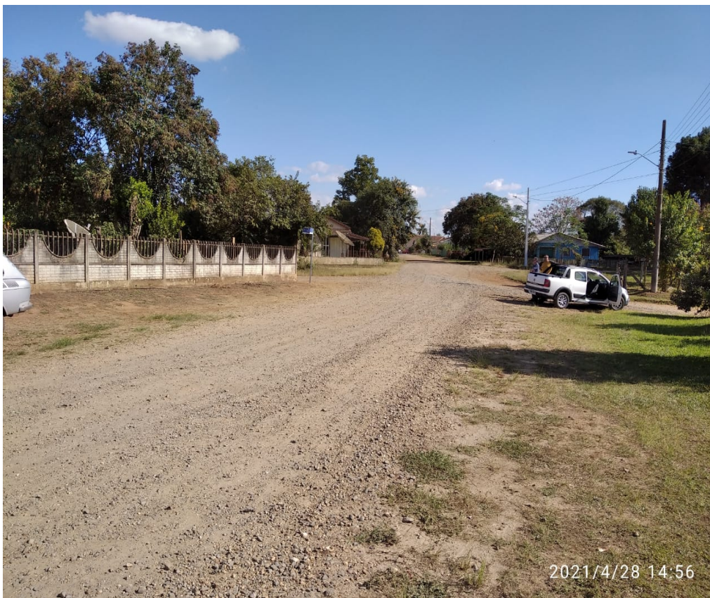
Figura 8 - Rua Piauí