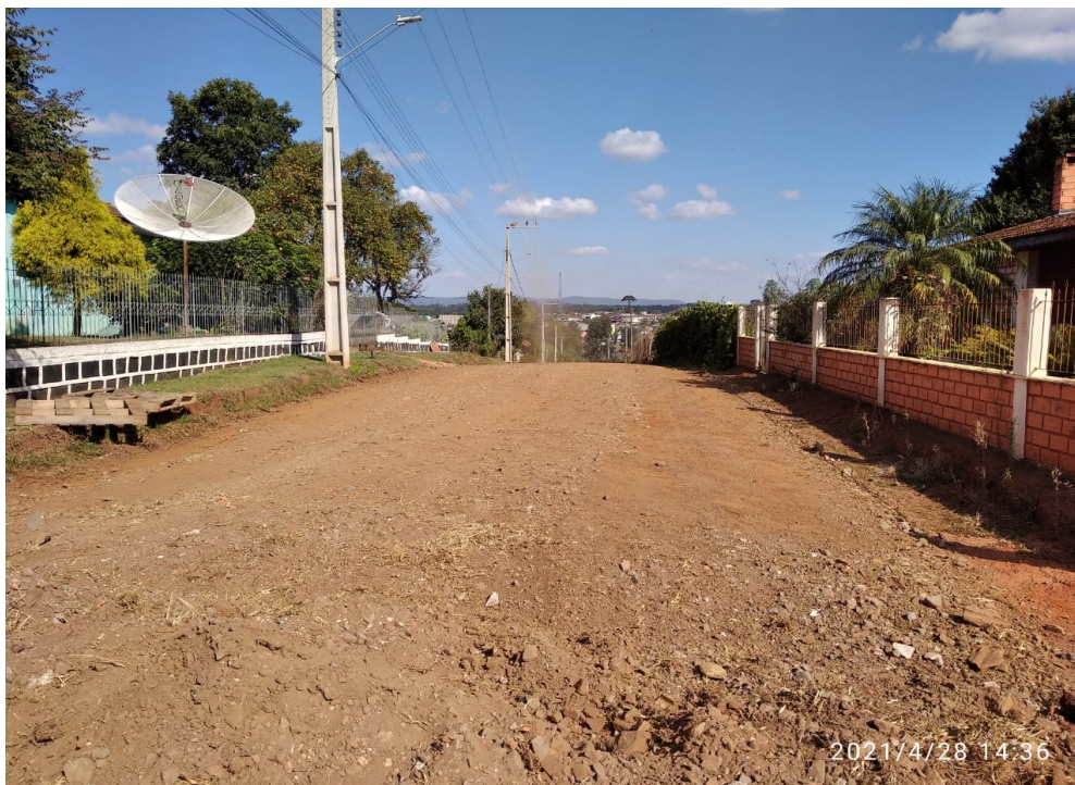
Figura 1 - Rua Mato Grosso