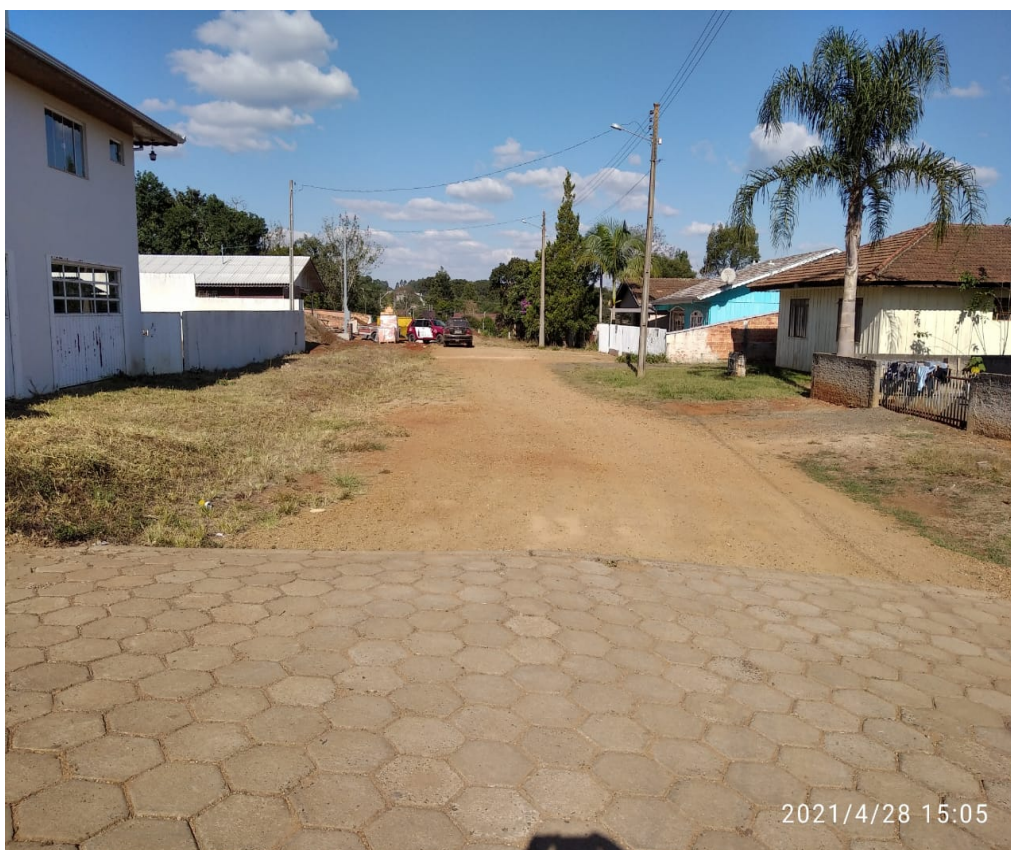
Figura 6 - Travessa Sergipe