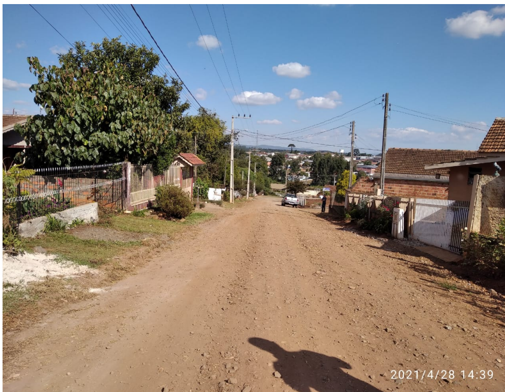
Figura 2 - RUA MATO GROSSO