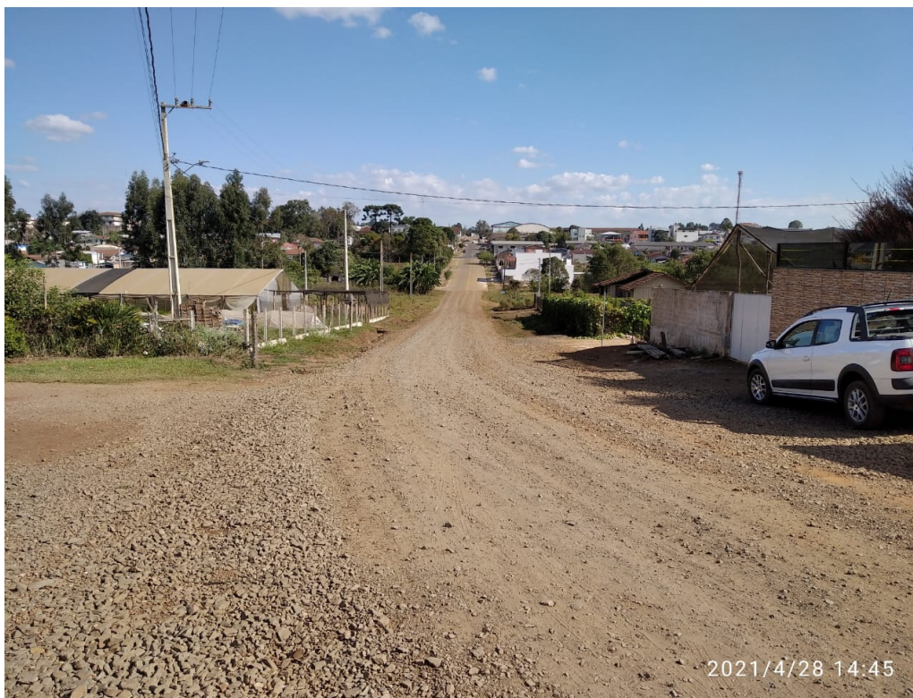
Figura 3- Rua Mato Grosso