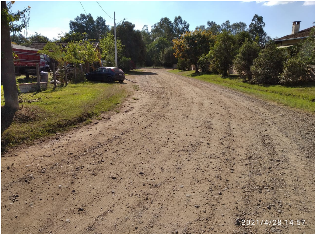
Figura 9 - Rua Alagoas