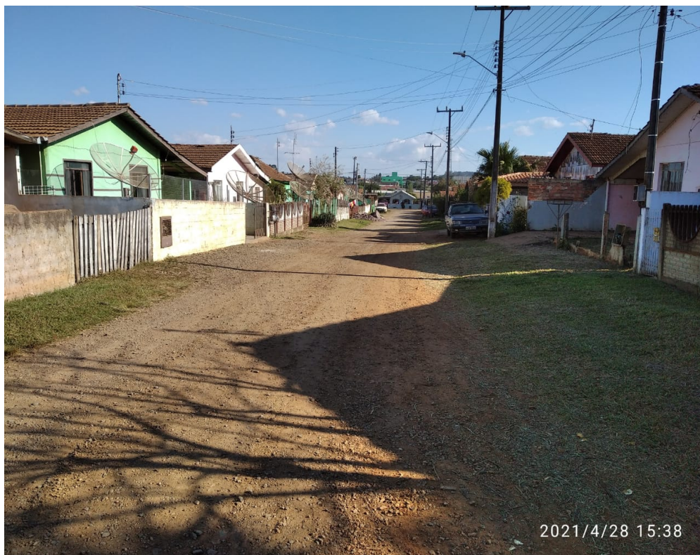
Figura 13 - Rua Exp. Eugênio Alves de Lima