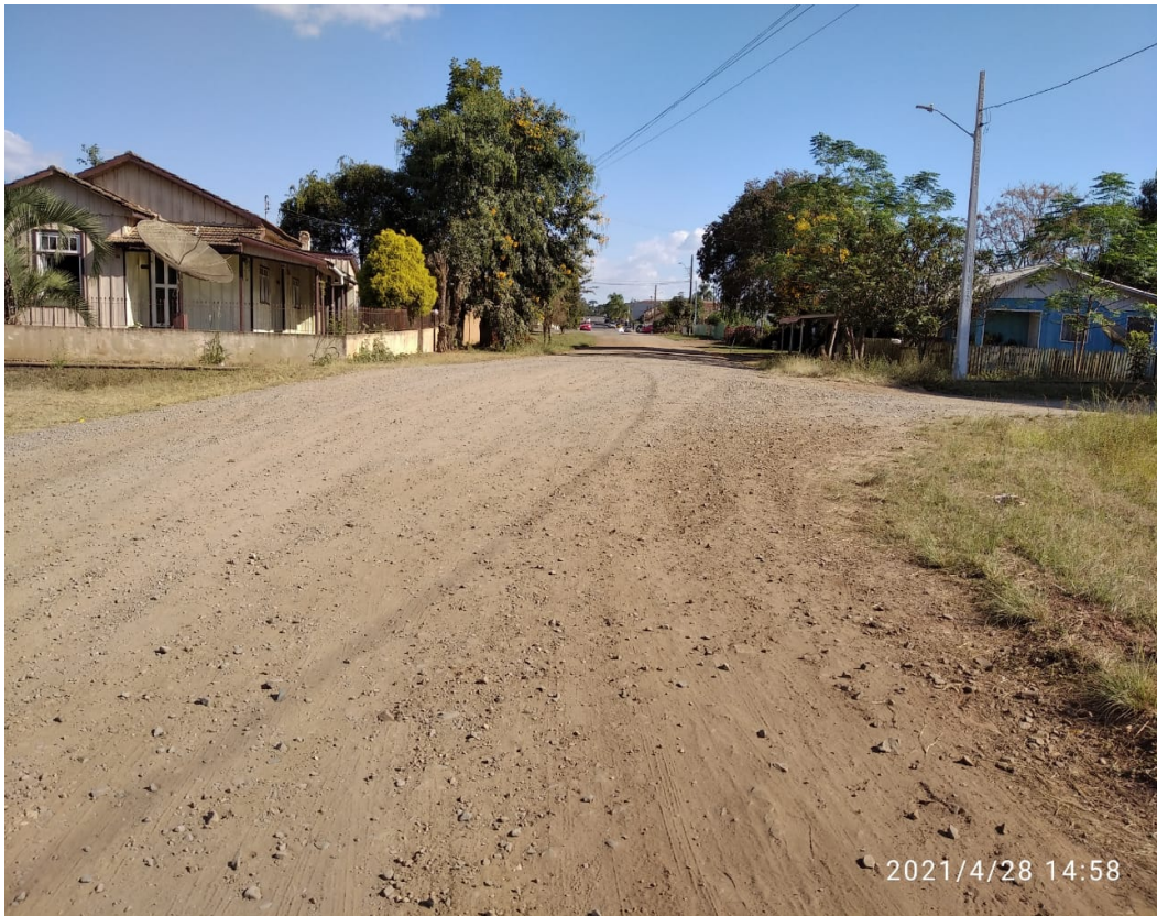
Figura 11 - Rua Rio Grande do Sul com Rua Piauí