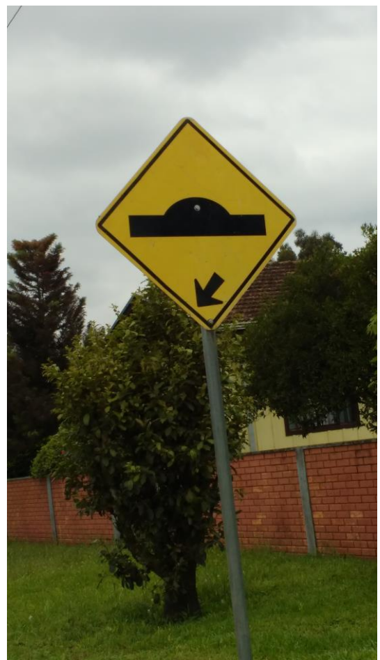
Sinalização em bom estado