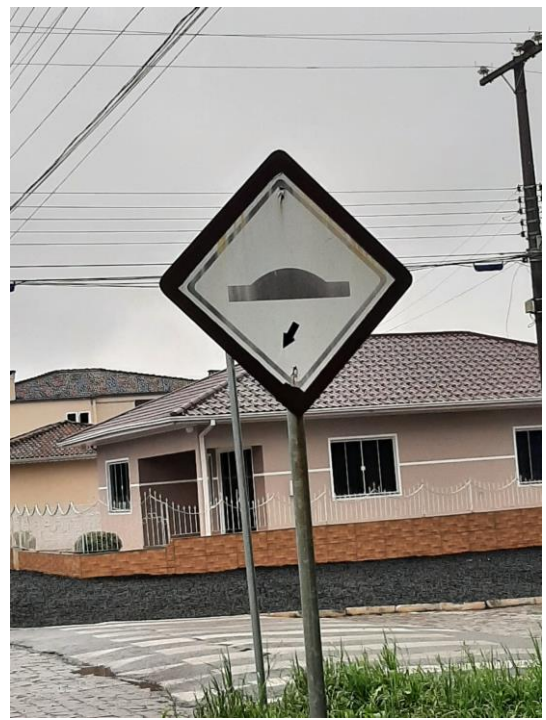
Sinalização desgastada pelo tempo