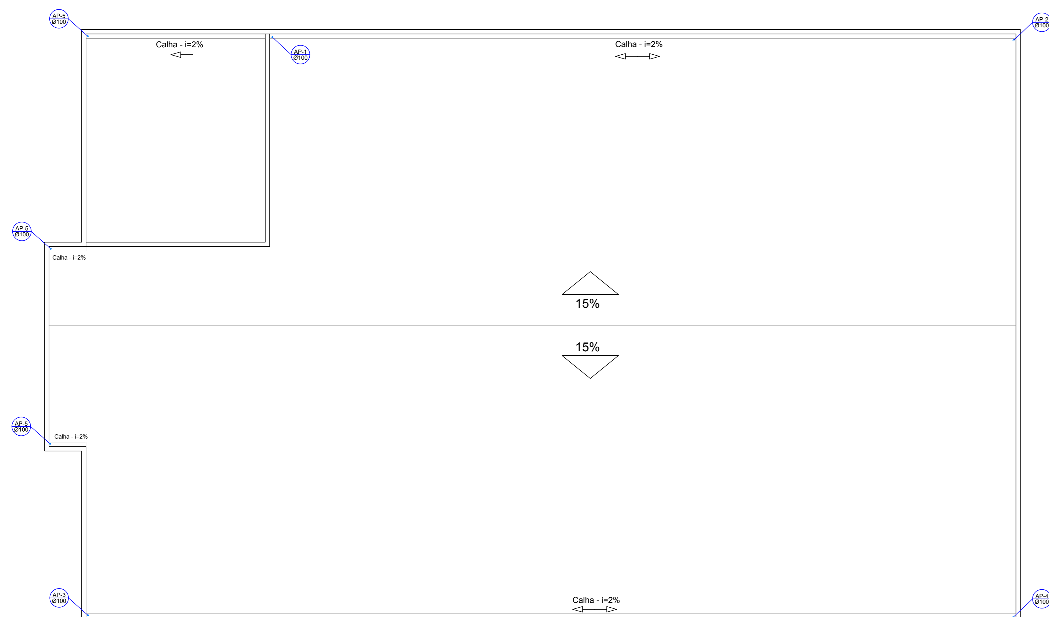
COBERTURA/ ESGOTO PLUVIAL esc:1/75