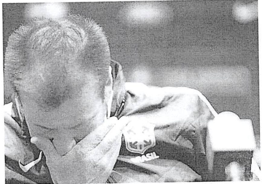
Desclassificação em duas Copas Américas e campanha nas Eliminatórias minaram trabalho de Dunga