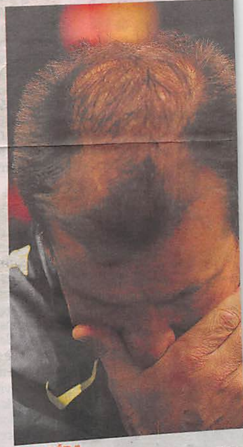
DE SAÍDA Desclassificação em duas Copas Américas