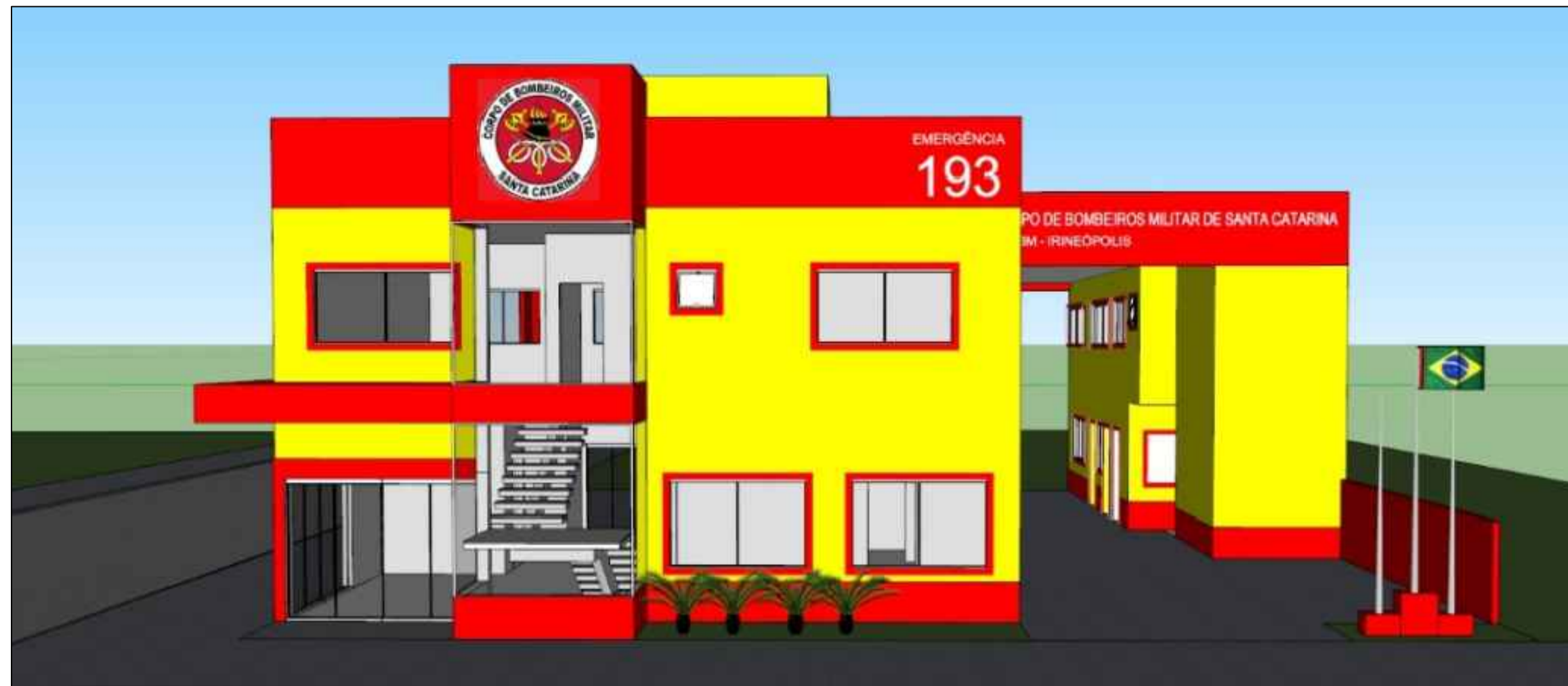
Elevação Frontal Esc: 1:75