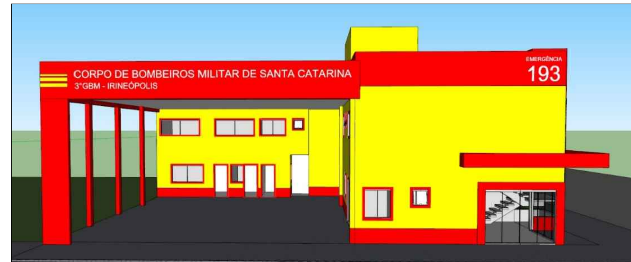
Elevação Lateral Esc: 1:75