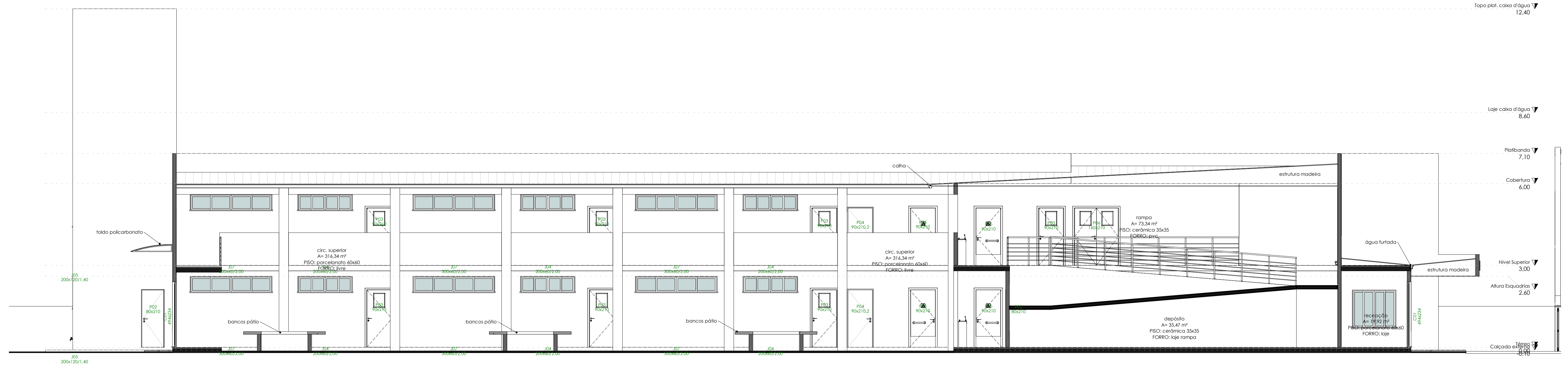
1 A 1 : 75