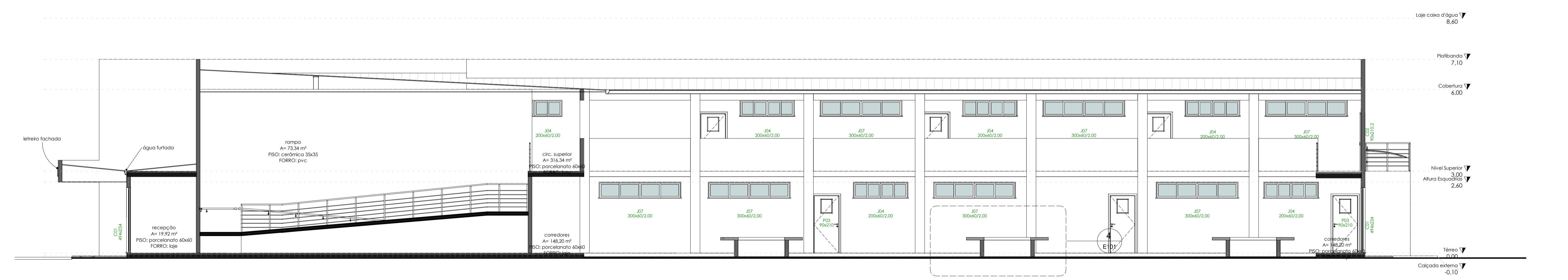
2 B 1 : 75